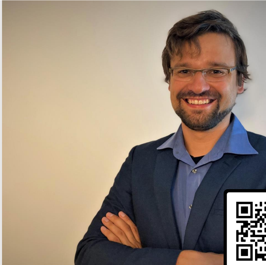
Ansprechpartner: Herr Sprechert